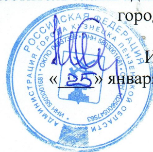
График дежурства членов народной дружины города Кузнецка на февраль 2023 года